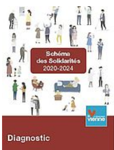
SCHÉMA DES SOLIDARITÉS 2020/2024 - 1/3