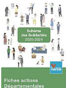
SCHÉMA DES SOLIDARITÉS 2020/2024 - 2/3