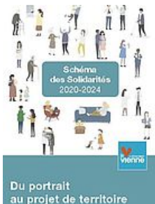
SCHÉMA DES SOLIDARITÉS 2020/2024 - 3/3