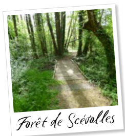
Forêt de Scévollès