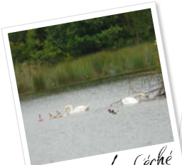
Domaine du Léché