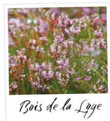
Bois de la Loge