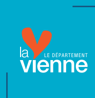
Table ronde du 22 avril 2016 Loudun